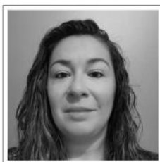
CHABRILLANGEAS MARGAUX Décharge de direction BRANTÔME