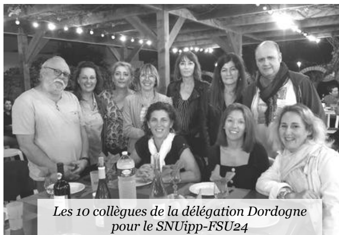
Les 10 collègues de la délégation Dordogne pour le SNUipp-FSU24