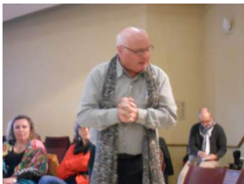
Lors des échanges avec la salle...